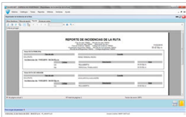
Reporte de Incidencias de Ruta